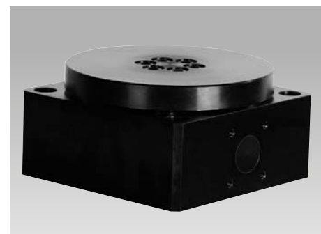
Modulo di rotazione - asse verticale DMV 1000 con piastra di collegamento Ø 170